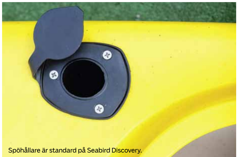
Spöhallare är standard på Seabird Discovery.